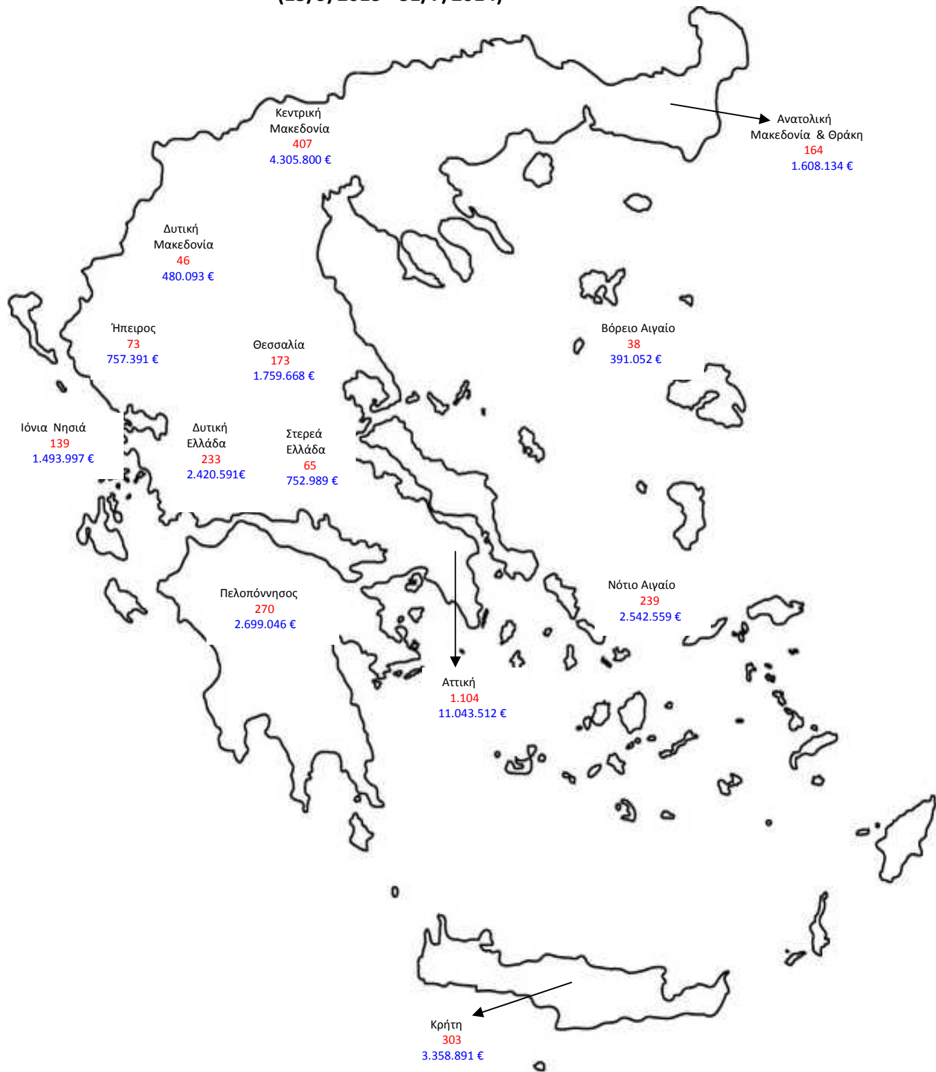
ΧΑΡΤΗΣ : ΑΔΗΛΩΤΟΙ ΕΡΓΑΖΟΜΕΝΟΙ ΚΑΙ ΠΟΣΑ ΕΠΙΒΛΗΘΕΝΤΩΝ ΠΡΟΣΤΙΜΩΝ ΑΝΑ ΠΕΡΙΦΕΡΕΙΑ