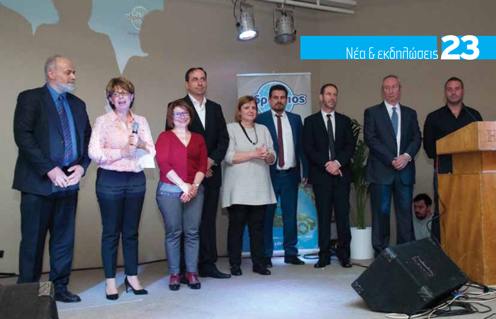
Τα στελέχη της Υδρογείου με τους συνεργάτες της εταιρείας στην Κεφαλονιά