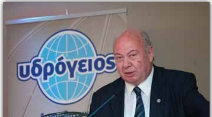
Αλέξανδρος Παρίσης, Δήμαρχος Κεφαλονιάς