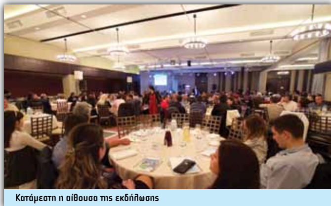
Κατάμεστη η αίθουσα της εκδήλωσης