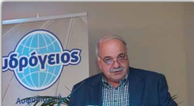
Σπυρίδων Γαλιασατός, Αντιπεριφερειάρχης Τουρισμού και Τουριστικής Προβολής Ιονίων Νήσων